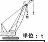
■ジブ定格総荷重表(マスト無)