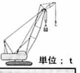
■ジブ付主ブーム定格総荷重表(マスト無)