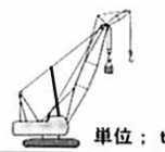
■ジブ付主ブーム定格総荷重表(マスト付)