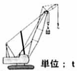
■ジブ付主ブーム定格総荷重表(マスト付)