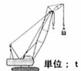
■ジブ定格総荷重表(マスト無)