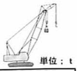
■ジブ付主ブーム定格総荷重表(マスト無)